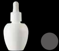
シンシア50SP珪 SINCERE 50SP GYOKU

20g 珪ガラス GYOKU(Opaque white glass) H37.5×W55.8(mm) CAP: PI-30GWc (AS/PP)