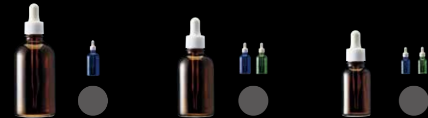
エムボトル No. 100 M BOTTLE No. 100

100mL ガラス Glass H132.0×W50.0(mm) CAP: スポイト No. 40L