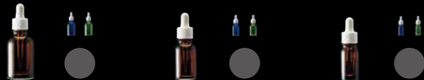
エムボトル No. 20 M BOTTLE No. 20

エムキャップ No.40 M CAP No.40 スクリューキャップ No.40L SCREW CAP No.40L エムスポイト No.40 M SPUIT NO.40 穴あき中栓 No.40 INNER PLUG No.40