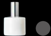
ルネッタ50AT珪 LUNETTA 50AT GYOKU

50mL 珪ガラス GYOKU(Opaque white glass) H97.6×W51.0(mm) CAP: DSスポイト