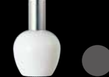
ルーチェ50AT珪 LUCHE 50AT GYOKU

50mL 珪ガラス GYOKU(Opaque white glass) H89.2×W54.1(mm) CAP: Z-75-1K07/ PCV-565-AL (M)